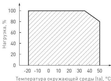
Рис. 2. Максимальная допустимая нагрузка, % от мощности источника.